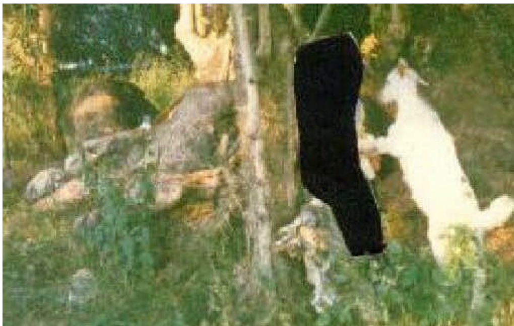
Foto 1: el marco negro indica la posición del pequeño junto al cabrito. Abajo, a la izquierda, el duende.

Pero se nos ocurre otra posibilidad, tal vez más seria (lo que no es más que un eufemismo para disfrazar nuestra reaccionaria actitud de rechazar hipótesis demasiado audaces). En Parapsicología conocemos un fenómeno llamado ectocoloplasmía , masa de ectoplasma –esa sustancia exudada por ciertos dotados– que adoptan una forma específica. Algo así como una ideoplastia o un tulpa , expresión tibetana para referirse a las formas de pensamiento . También hemos tomado debida nota de la relativa facilidad de obtener escotofotografías (literalmente: “fotografías en la oscuridad”) o, más correctamente, psicofotografías , como las de Ted Serios y otros. Así que la teoría es sencilla: el intenso deseo de los testigos por ver algo, o las energías remanentes de los grupos que visitan –en ocasiones con un alto nivel de dolor, estrés y esperanza– el lugar, podría haber creado esa fantasmagórica aparición, alimentada en recuerdos infantiles (porque, después de todo, ¿qué buscamos los amigos de lo insólito, sino satisfacer los sueños del niño que llevamos dentro?) y significando que entre el mundo de las ilusiones mágicas y el de la prosaica realidad cotidiana existe un vaso comunicante: el que duerme en los estratos más profundos del inconsciente del hombre.