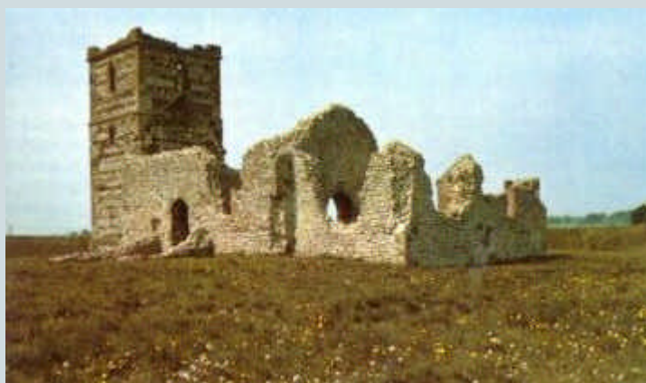
Las ruinas de la iglesia de Knowlton (Dorset) que se alza en el centro de un gran recinto de tierra. A menudo, las iglesias se construían en lugares sagrados megalíticos, y suelen ser marcadores de líneas ley.

La idea de Underwood de una fuerza de la tierra que viajaba a lo largo de las líneas geodésicas es