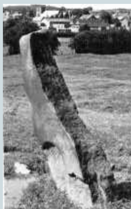
Esta piedra vertical de Anstey (Leicestershire) se alinea con la iglesia que se ve al fondo.

Entendía que incluso la construcción de las iglesias medievales y de las catedrales había sido determinada hasta cierto punto por las líneas de la fuerza de la tierra. El tamaño y la forma de un cementerio, la posición de la verja, la alineación de la nave, etc., dependían de líneas geodésicas, y debajo de la gradería solía haber una fuente ciega.