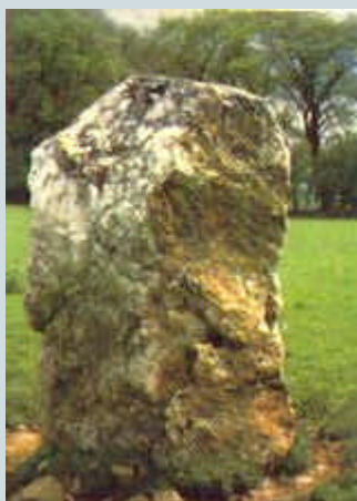
Un menhir de cuarzo en Cregg (Country Kerry, Irlanda)

También se ha sugerido que la presencia de cuarzo en los restos megalíticos puede ser la causa de la fuerza de la tierra. El cuarzo es uno de los minerales más comunes, por lo que el hecho de que aparezca en los restos megalíticos no es sorprendente en sí mismo. Sin embargo, lo más notable es que este mineral es piezoeléctrico, es decir, se carga eléctricamente cuando se le somete a una presión física. Se afirma que la cantidad de carga que se produce entonces es suficiente como para afectar a la ionización del aire circundante, hasta el extremo de determinar cambios fisiológicos en los cuerpos de los seres vivos que puedan hallarse en las cercanías.