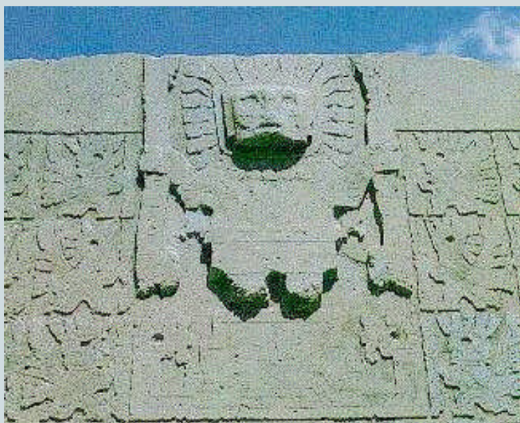
Puerta del Sol

En la tercera columna de la parte derecha se observa la cabeza de un elefante y esto es sorprendente pues no existen elefantes en América, aunque sí habían existido en tiempos prehistóricos. Los miembros de una especie llamada Cuvieronius, un proboscideo parecido a un elefante que estaba dotado de colmillos y trompa, de aspecto extraordinariamente similar a los "elefantes" de la Puerta del Sol, habían abundado en la zona meridional de los Andes, hasta su repentina extinción hacia el 10.000 a.C.