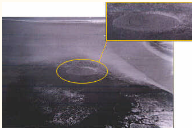
Imagen retrospectiva del cráter. En la parte superior derecha podemos observarlo a mayor escala.

Uno de los casos OVNI donde mejor se manifiesta el estrecho vínculo entre los No Identificados y el misterioso cráter de Cádiz, fue el suceso vivido por la familia Mestres en las cercanías de la misteriosa fosa en octubre de 1985.