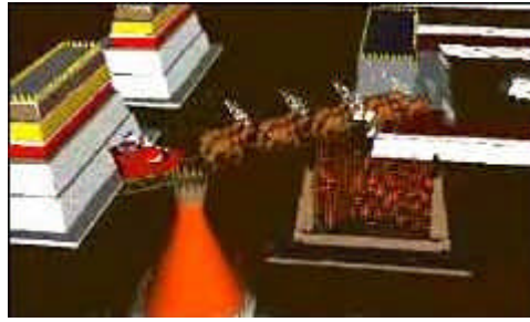
Papa Noel saluda mientras pasa por las Ruinas de los Incas. (Perú).

Mucho antes de que los hermanos Wright volaran por primera vez en Estados Unidos, o de que los hermanos Montgolfier volaran el primer globo sobre Francia, Santa Claus sabía de una manera muy eficaz para llegar de casa a casa a grandes velocidades. Tal vez Papá Noel oyó de los renos que volaban sobre el Polo Norte y fue a buscar a los animales. Por supuesto, cualquier información sobre estos animales es un misterio.