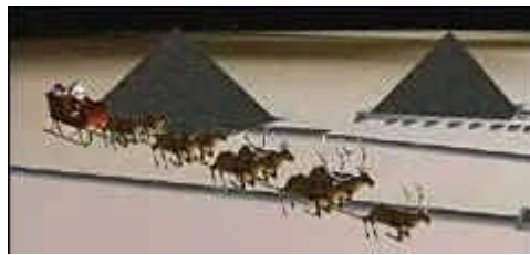
San Nicolás sobrevolando las Pirámides. (Egipto)

Mucho antes de que los hermanos Wright volaran por primera vez en Estados Unidos, o de que los hermanos Montgolfier volaran el primer globo sobre Francia, Santa Claus sabía de una manera muy eficaz para llegar de casa a casa a grandes velocidades. Tal vez Papá Noel oyó de los renos que volaban sobre el Polo Norte y fue a buscar a los animales. Por supuesto, cualquier información sobre estos animales es un misterio.