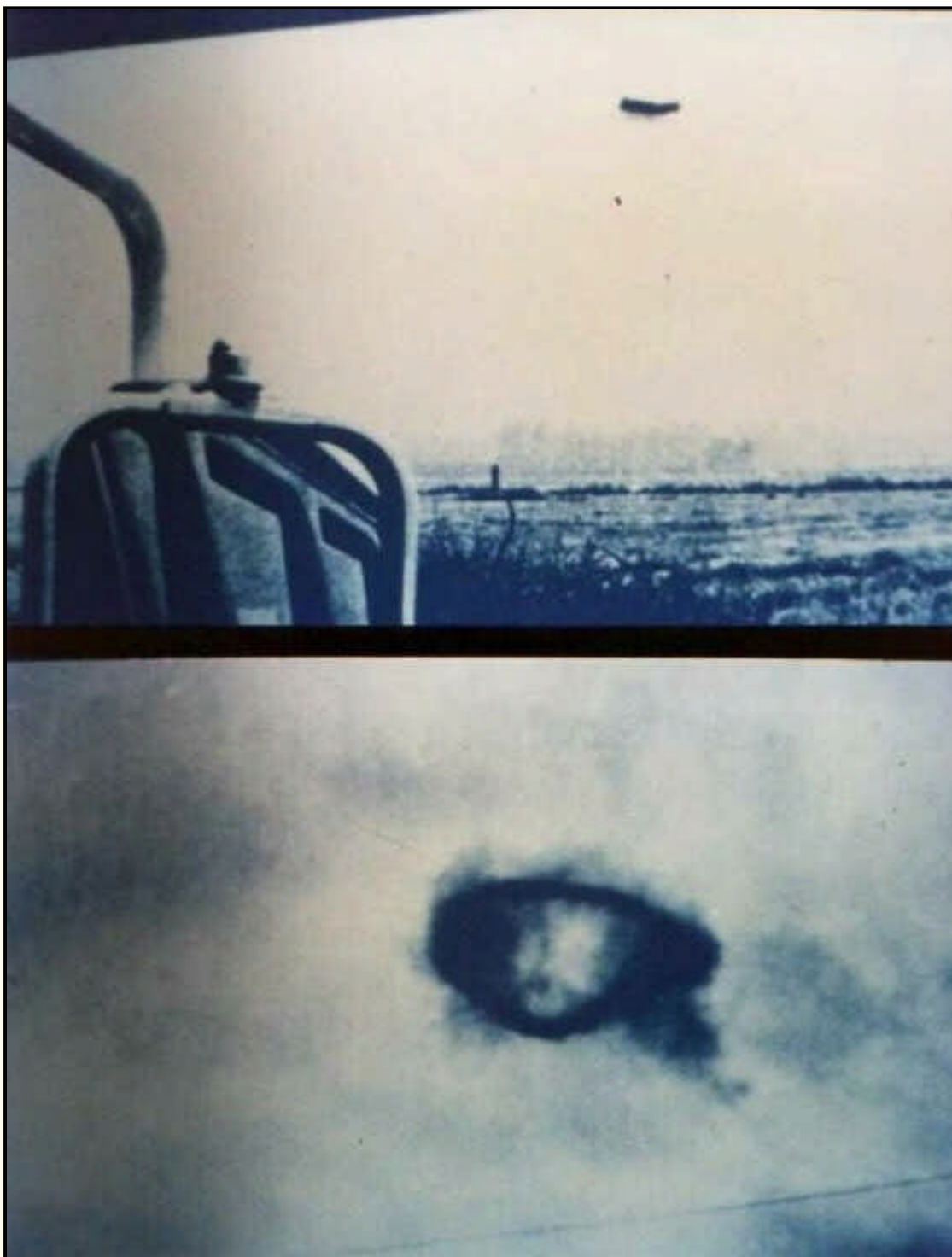
Fotografías tomadas el 3 de agosto de 1965 cerca de Santa Ana, California, EE.UU. Las mismas continúan hoy envueltas en un misterio...