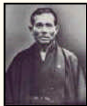
Sensei Kambun Uechi

Aunque poco se sabe de los 13 años de Kambun Sensei en China, ocasionalmente contó historias a sus discípulos de sus viajes y el estudio del Karate. Su hijo Kanei Uechi Sensei dijo que Kambun dirigía todas sus energías hacia la Maestría del Karate. Kambun no sólo aprendió la parte física –la que incluía medicina China– sino también la filosofía subyacente, la cual dejó una impresión duradera en él.