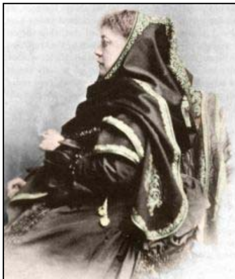
H.P.B. 1875, la esfinge ocultista (6)