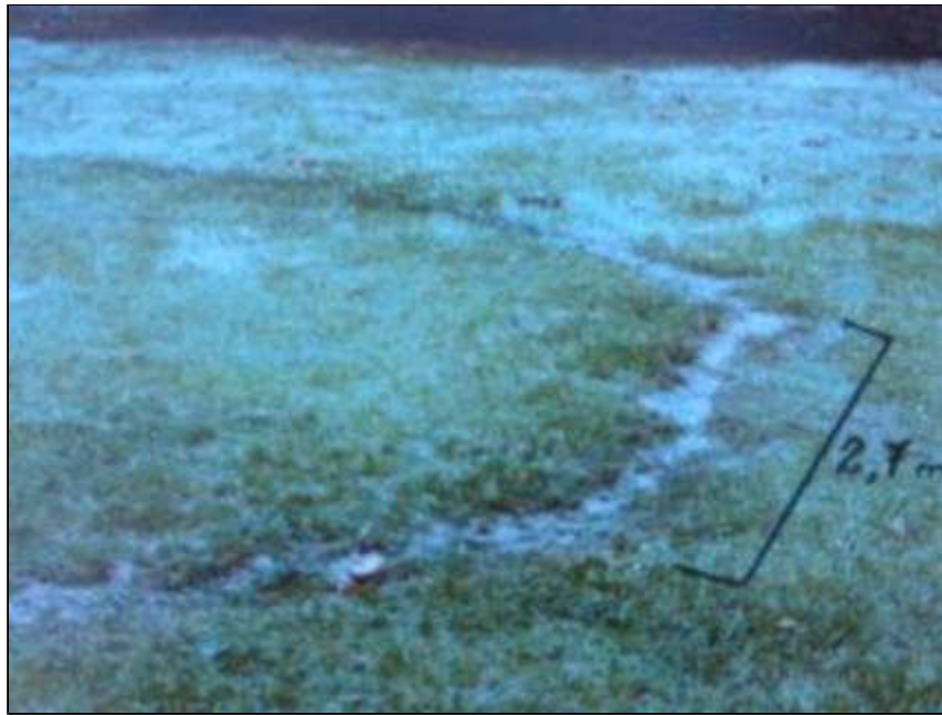
Ilustraciones y fotografías, cortesía de Jorge Aumasane.