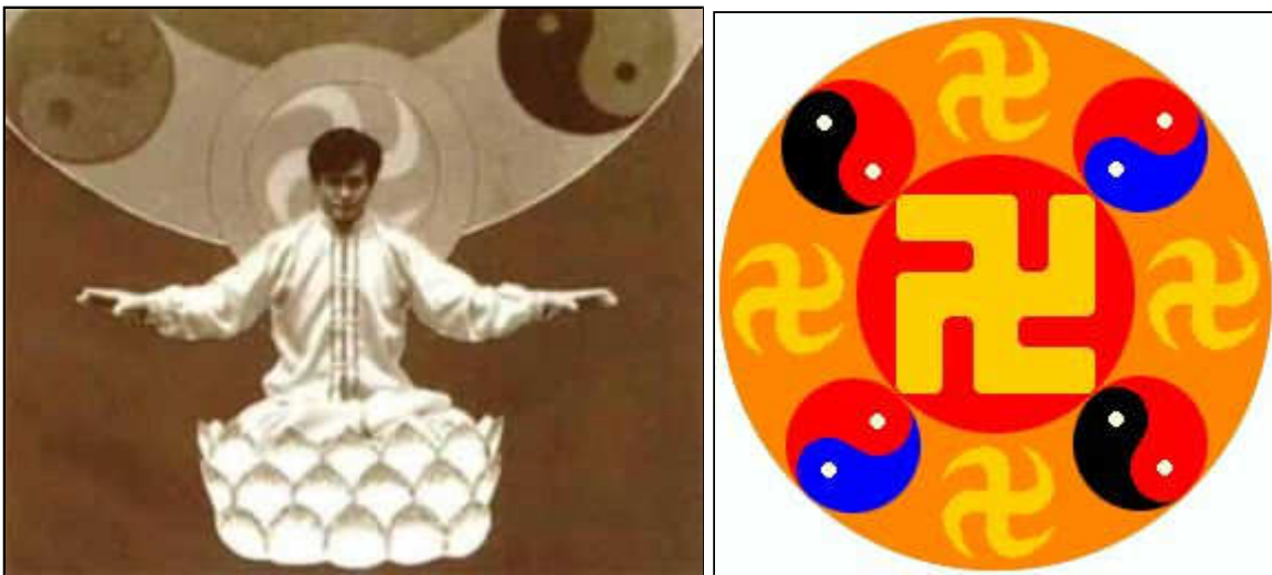
“imagen de Dharma” y el emblema-símbolo de Falun Dafa