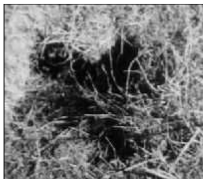
Un ejemplo. Huella de aterrizaje OVNI en Victoria (provincia de Entre Ríos, Argentina, 1991) investigado por el autor.